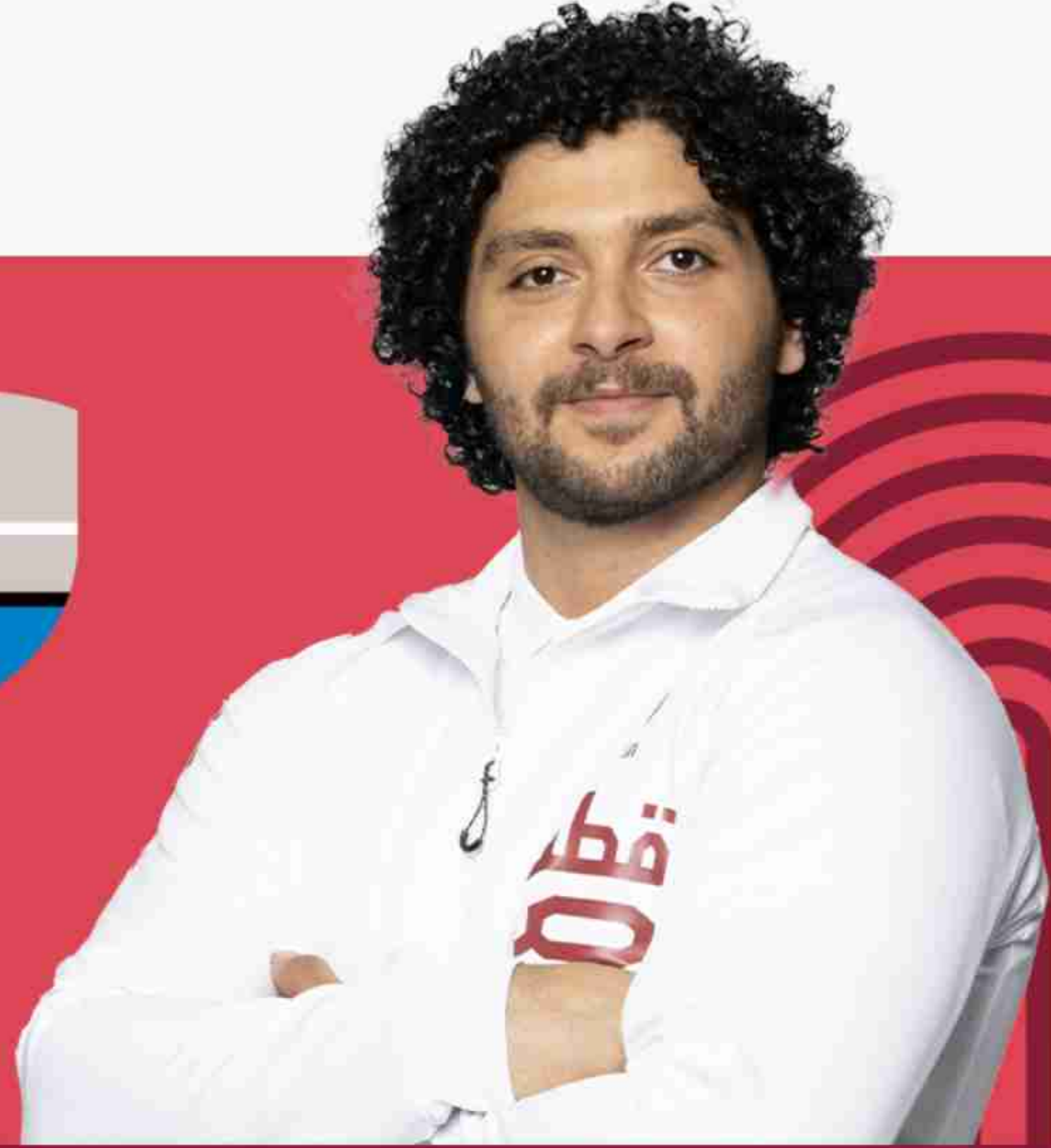
فارس إبراهيم حسونة رفع الأثقال

تأهل الرباع فارس إبراهيم إلى دورة الألعاب الأولمبية "باريس 2024". بعد أن أحرز الميدالية فضية ضمن منافسات بطولة العالم لرفع الأثقال للكبار في السعودية في وزن 102 وكان الرباع فارس إبراهيم قد أحرز الميدالية الذهبية في دورة الألعاب الأولمبية طوكيو 2020 بمنافسات رفع الأثقال للرجال لوزن 96 كغم، برقم قياسي أولمبي، بوزن إجمالي قدره 402 كغم (177 كغم في منافسات الخطف، و225 كغم في منافسات النتر وهو أيضا رقم قياسي أولمبي كما حصل على الميدالية الذهبية في وزن 96 كلج في بطولة كأس قطر الدولية لرفع الأثقال للرجال والسيدات في نسختها السادسة كما شارك أيضا في دورة الألعاب الأولمبية "ريو 2016" في وزن 85 كغم لرفع الأثقال. وكانت أول مشاركة رسمية له مع المنتخب عام 2014 في بطولة كأس قطر الدولية لرفع الأثقال وأحرز فارس إبراهيم ميداليتين، ذهبية وفضية، في وزن 102 كيلوغرام ضمن منافسات بطولة العالم لرفع الأثقال في العاصمة الكولومبية بوجوتا عام 2022