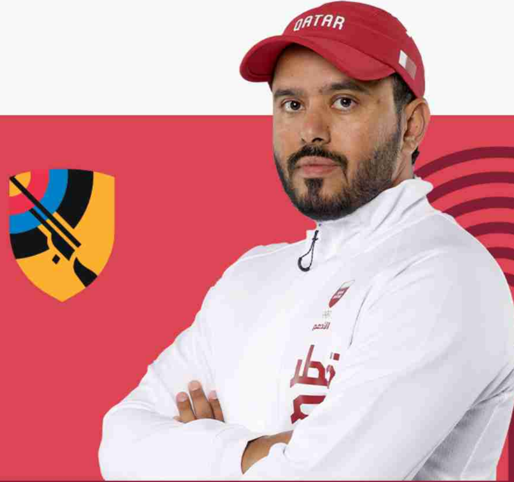
راشد صالح العذبة الرمية

تأهل الرباع فارس إبراهيم إلى دورة الألعاب الأولمبية "باريس 2024". بعد أن أحرز الميدالية فضية ضمن منافسات بطولة العالم لرفع الأثقال للكبار في السعودية في وزن 102 وكان الرباع فارس إبراهيم قد أحرز الميدالية الذهبية في دورة الألعاب الأولمبية طوكيو 2020 بمنافسات رفع الأثقال للرجال لوزن 96 كغم، برقم قياسي أولمبي، بوزن إجمالي قدره 402 كغم (177 كغم في منافسات الخطف، و225 كغم في منافسات النتر وهو أيضا رقم قياسي أولمبي كما حصل على الميدالية الذهبية في وزن 96 كلج في بطولة كأس قطر الدولية لرفع الأثقال للرجال والسيدات في نسختها السادسة كما شارك أيضا في دورة الألعاب الأولمبية "ريو 2016" في وزن 85 كغم لرفع الأثقال. وكانت أول مشاركة رسمية له مع المنتخب عام 2014 في بطولة كأس قطر الدولية لرفع الأثقال وأحرز فارس إبراهيم ميداليتين، ذهبية وفضية، في وزن 102 كيلوغرام ضمن منافسات بطولة العالم لرفع الأثقال في العاصمة الكولومبية بوجوتا عام 2022