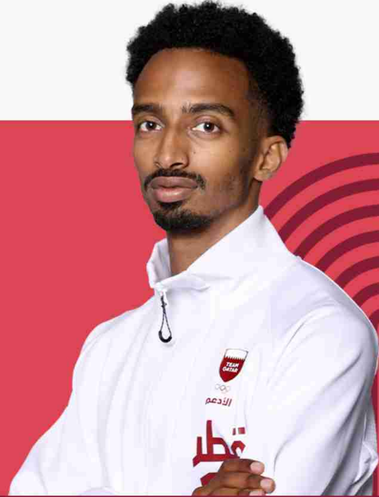
ابوبكر حيدر ألعاب القوى

تأهل أبو بكر عبد الله لاعب أدمم ألعاب القوى إلى أولمبياد باريس 2024 وذلك بفوزه بالمركز الأول لسباق 800 م في بطولة ألعاب القوى المقامة في إسبانيا شارك ابوبكر حيدر في دورة الألعاب الأولمبية طوكيو 2020 بعد أن تأهل وحل رابعا في سباق 800 بزمن قدره 1:46.27 دقيقة في جولة الدوحة للدوري الماسي 2019 وحقق اللاعب أبو بكر حيدر عبدالله البالغ من العمر 26 عاما، العديد من الميداليات بالبطولات الآسيوية للشباب . وفاز بأول سباق كرياضي في الفريق الأول في سباق 400×4م تتابع، وسجل رقماً قياسياً جديداً في دورة الألعاب الآسيوية لألعاب القوى داخل الصالات، كما شارك في الأولمبياد في ريو دي جانيرو 2016