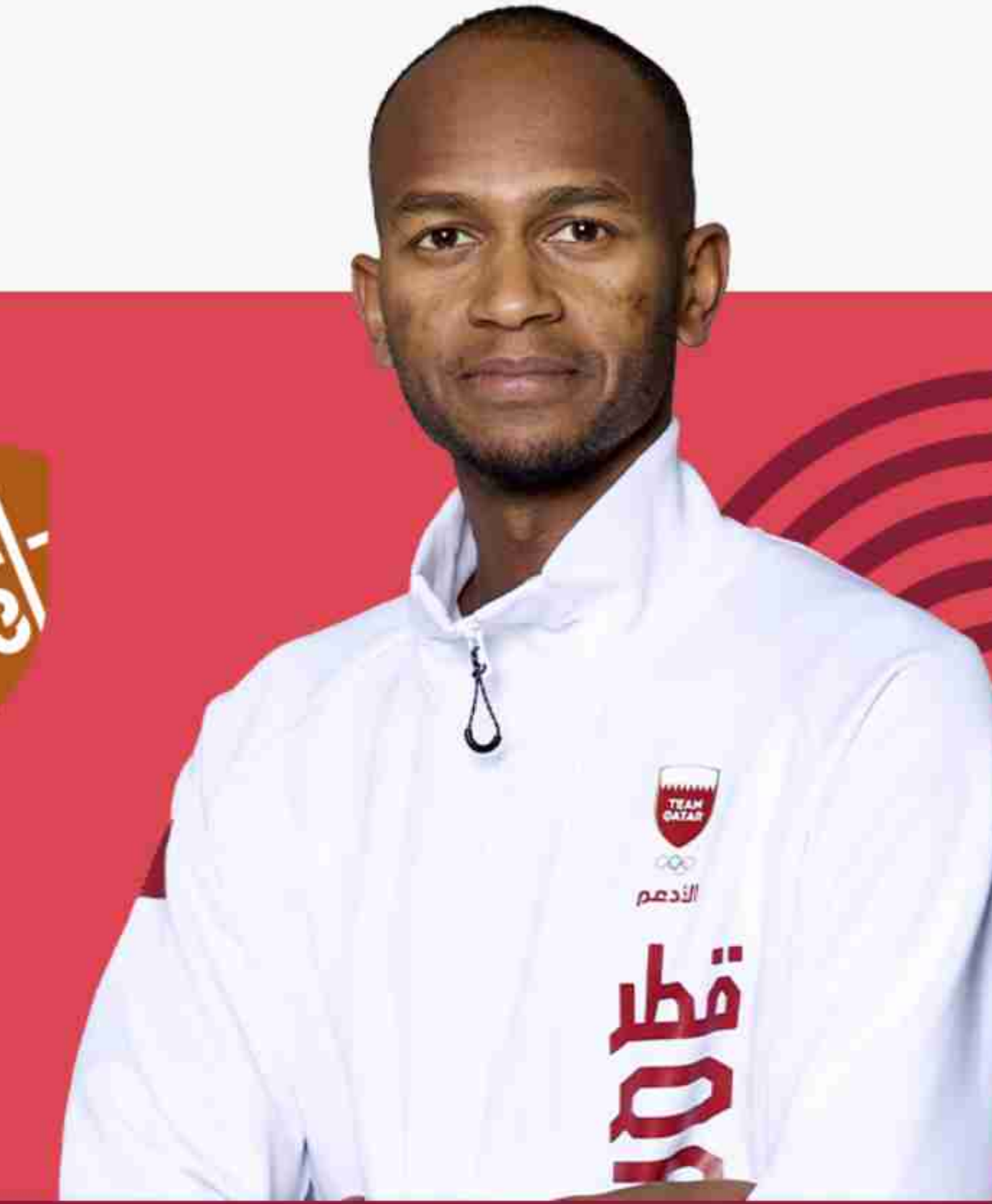
معتز عيسى برشم ألعاب القوى

عبدالرحمن صامبا البالغ من العمر 28 عاماً، صاحب برونزية الأربعة مائة متر حواجز في بطولة العالم الدوحة 2019. كما شارك البطل القطري عبدالرحمن صامبا في اولمبياد طوكيو 2020 بعد ان فاز بسباق 400 م حواجز الذي اقيم ضمن لقاء شنغهاي الجولة الثانية من بطولة الدوري الماسي لألعاب القوى 2019 وفيها احرز البطل القطري المركز الاول للسباق محققا افضل رقم عالمي لهذه السنة ورقم جديد للقاء شنغهاي وهو 27,47 ثانية ثم احراز ذهبية 400م حواجز في دورة الألعاب الآسيوية في هانغتشو 2022